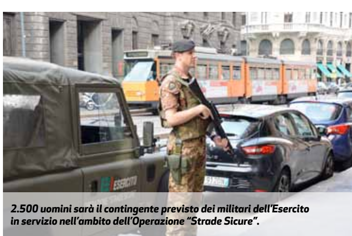
2.500 uomini sarà il contingente previsto dei militari dell'Esercito in servizio nell'ambito dell'Operazione "Strade Sicure".