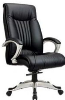
Figura 3 - immagine indicativa di poltrona direzionale