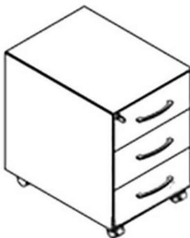
Figura 2 - immagine indicativa di cassetiera