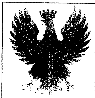
Figura 1 - Aquila turrata della Polizia di Stato

Il nuovo logo dell'aquila turrata della Polizia di Stato, pubblicato nel Decreto inter-direttoriale 5/4/2018, recante " Determinazione dei distintivi di qualifica per il personale delle Forze di polizia, ai sensi dell'art. 45, comma 20, del D. lgs. n° 95 del 29/5/2017, " è riportato in Figura 1 e iscritto in un quadrato di 30 mm di lato.