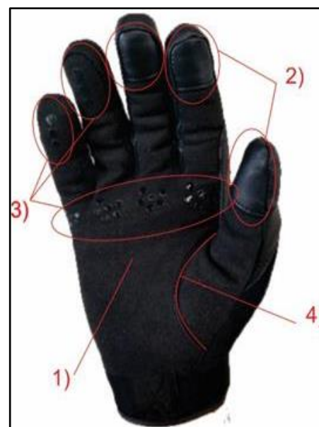
Figura 1 – Palmo del guanto

Ogni eventuale, ulteriore, dettaglio costruttivo considerato utile ai fini del raggiungimento delle caratteristiche generali richieste al Capo 1 , potrà esser apportato alla configurazione di base e sarà oggetto di valutazione da parte della Commissione.