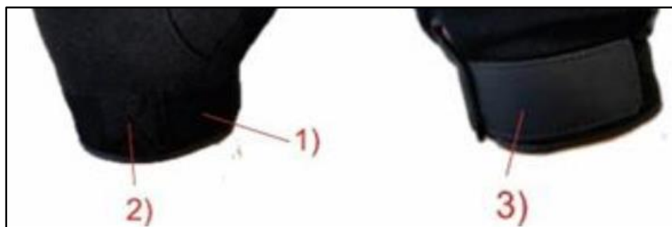
Figura 3 – Polsino del guanto per divisa operativa in vista palmare e dorsale

La previsione, sull'alamaro di chiusura, dell'incisione del logo Polizia di Stato (di colore nero), come mostrato in Appendice , costituirà un elemento di premialità, come meglio specificato al paragrafo 6.1.1 .