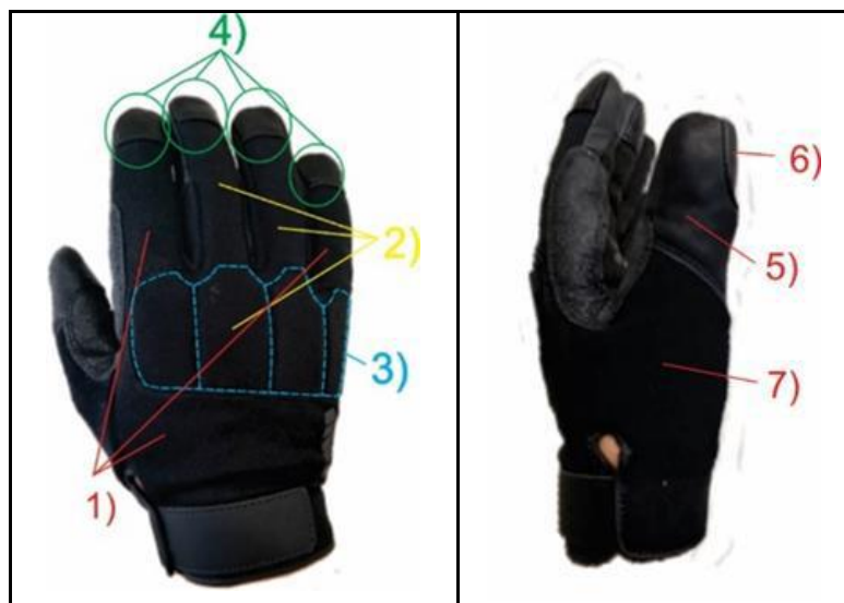
Figura 2 – Dorso del guanto per divisa operativa in vista frontale e laterale